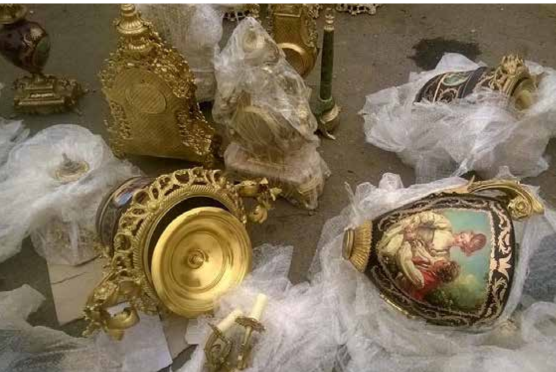
Piezas de porcelana de la dinastía Mehmet Alí recuperadas durante la operación MONITOR EYE de INTERPOL llevada a cabo en Egipto en 2015.

Las personas y/o grupos involucrados en la destrucción intencional del patrimonio cultural, incluido el saqueo, deberían ser enjuiciados debidamente.