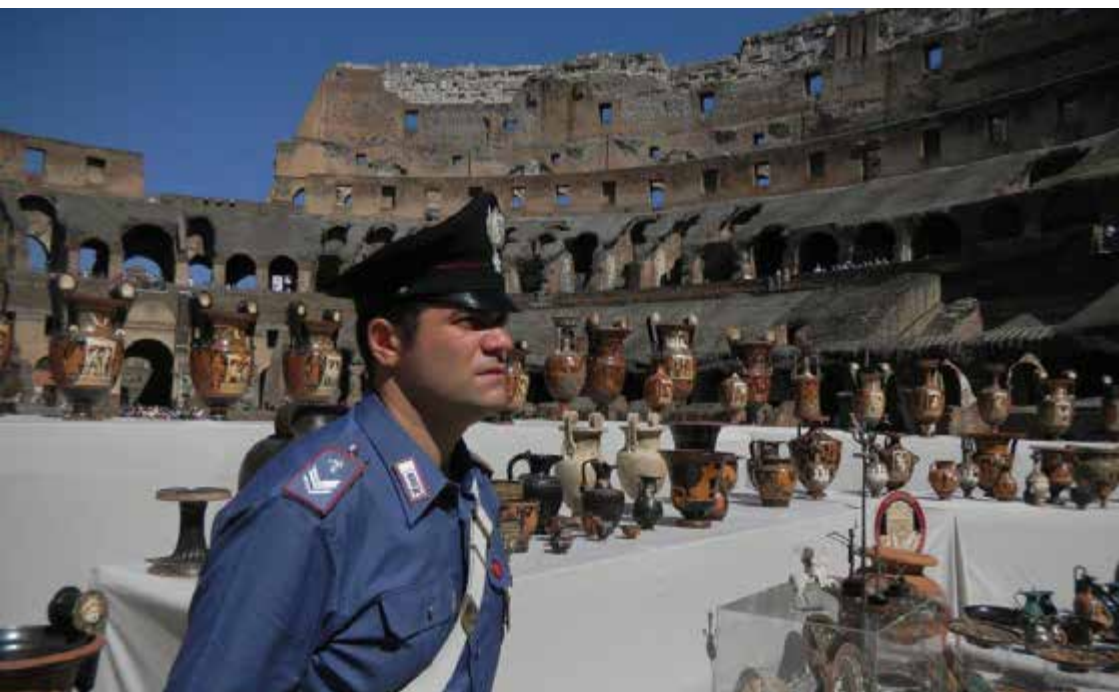
Rueda de prensa convocada por los Carabinieri italianos en el Coliseo, Roma, en 2010. Presentación de 337 antigüedades recuperadas en Ginebra (Suiza) en el marco de la operación ANDROMEDA.

Con el objeto de proteger el patrimonio cultural, Italia, Jordania, INTERPOL, UNESCO y la ONUDD elaboraron una lista de medidas claves. Dichas medidas están basadas en los resultados de estas reuniones, así como también en las directrices exhaustivas adoptadas en apoyo de la aplicación de la Convención de la UNESCO de 1970 y de la Convención de las Naciones Unidas sobre la Delincuencia Organizada Transnacional, y en las prioridades de los expertos que trabajan en el terreno.